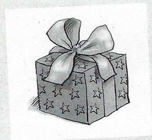
Illustration: Hendrik Kranenberg